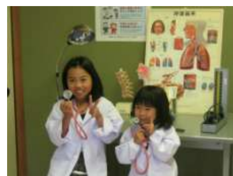
地域医療を守る会との連携