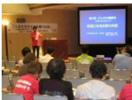
九州保健福祉大学との連携

「どんけん」での健康づくりに取り組んでいる事業所の紹介や「どんだけ健康会」での医療や健康づくりに関する団体や事業者等の参加と併せて「のべおか健康サポーター養成講座」での延岡市医師会所属の医師などへの講師の依頼、参加者への会員勧誘など、この活動を通じて、横のつながり・ネットワーク化が着実に進んできているところです。