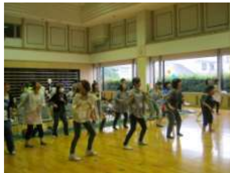
運動系のイベント