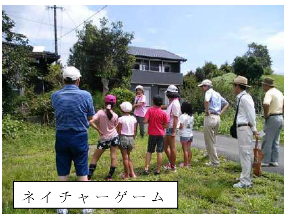
ネイチャーゲーム