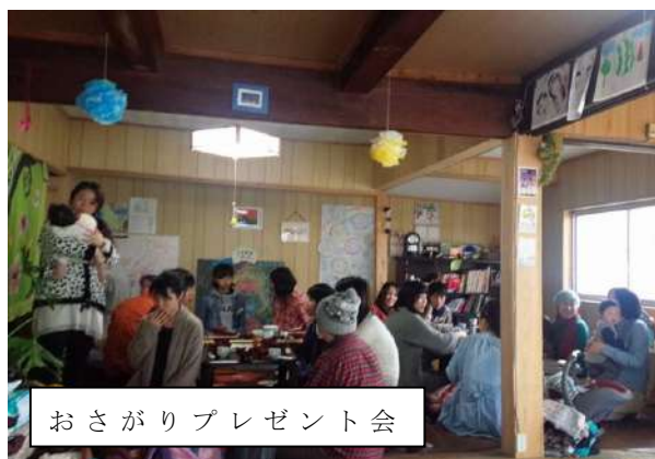
おさがりプレゼント会