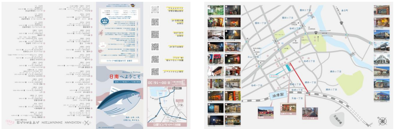
観光マップ「日南へようこそ」

結果として、市内28店舗の情報を掲載した「日南へようこそ」を作成した。さらに、観光情報の一元化を図る観点から、各情報サイトの二次元コードやバスの時刻表も掲載し、観光客向けの情報を集約したマップとして作成した。