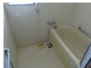
候補地としてあげた公営住宅の現状