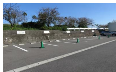
RVパーク亀川マリナーテラス (別府市)