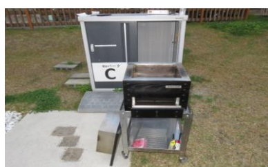
バーベキュー設備 (宗像市)