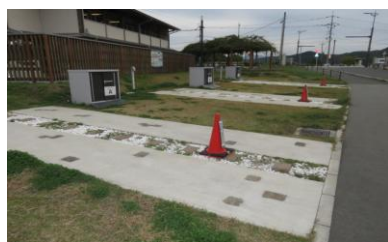
道の駅「むなかた」駐車スペース (宗像市)

また、糸島市の「RVパーク smart 糸島ファームハウスUOVO」と別府市の「RVパーク亀川マリナーテラス」は、「道の駅むなかた」と比較して簡易な施設ではあったものの、ある程度稼働の実績があることから小規模導入の可能性も確認できた。