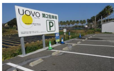
RVパーク smart 糸島ファームハウスUOVO (糸島市)