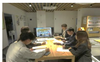
担当者による説明 (宗像市)